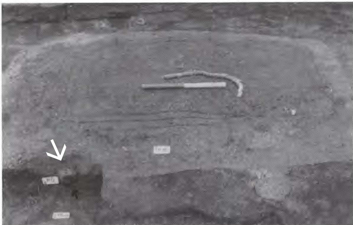
Arnen set fra syd. Det pilen peger på er lerkoppen, nedsat som husoffer. »Slangen« på arnen er en rod.

Omkring arne NN blev konstateret flere stolpespor, hvoraf nogle sikkert er de tagbærende stolper. Arnesteder anlægges sædvanligvis midt mellem fire tagbærende stolper.