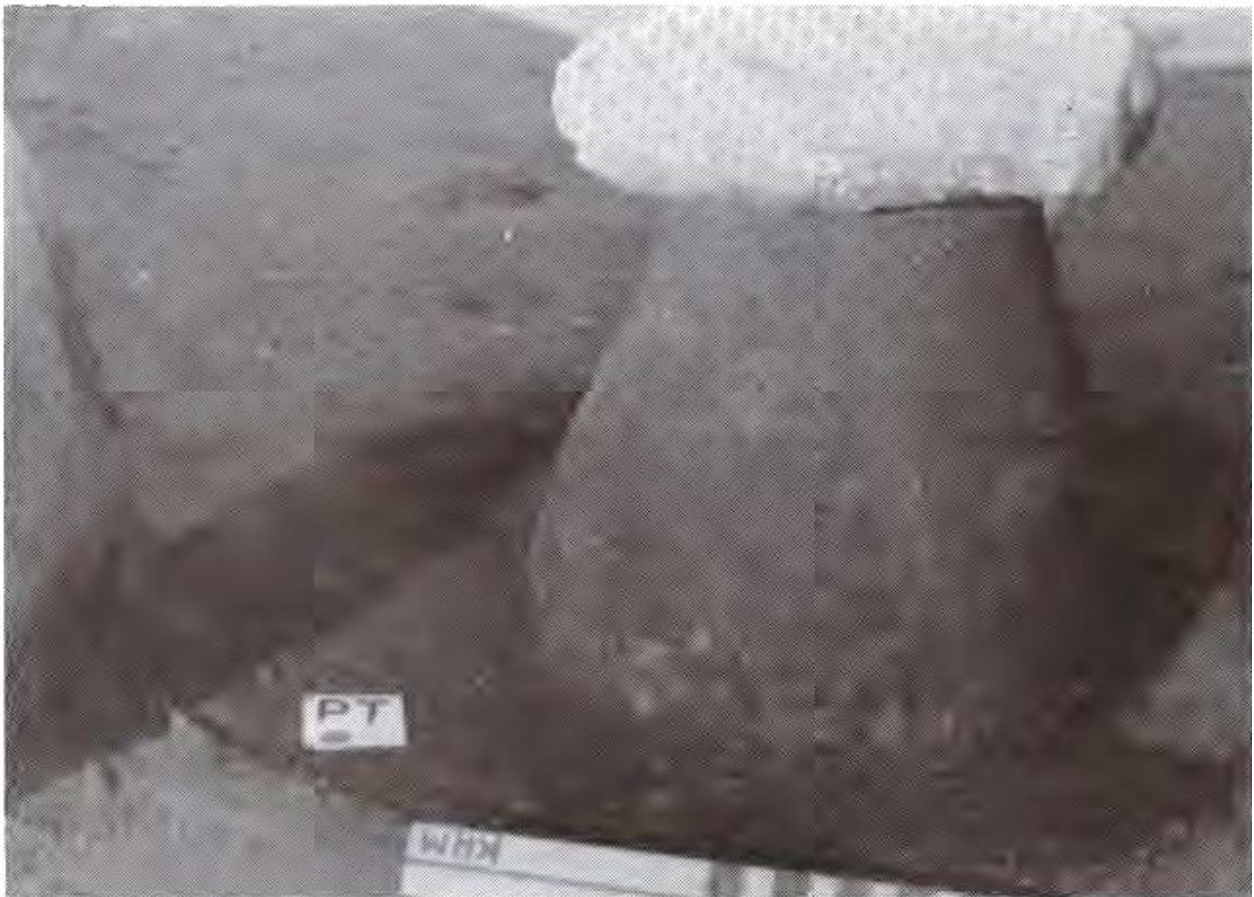
Urne efter at stenpakningen er fjernet, bemærk gruben under urnen.

Det var en urnegrav - PT - med en lerurne nedsat i en grube i jorden og ompakket med sten. Gruben var gravet et godt stykke ned i undergrunden, der var gult sand under et 20-30 cm tykt koksgråt kulturlag. I grubens bund havde man hældt resterne fra ligbålet i form af sod, trækul og benpartikler. Urnen blev herefter stillet ned oven i bålresterne og derefter pakket med sten. Øverst blev urnen lukket med den flade sten.