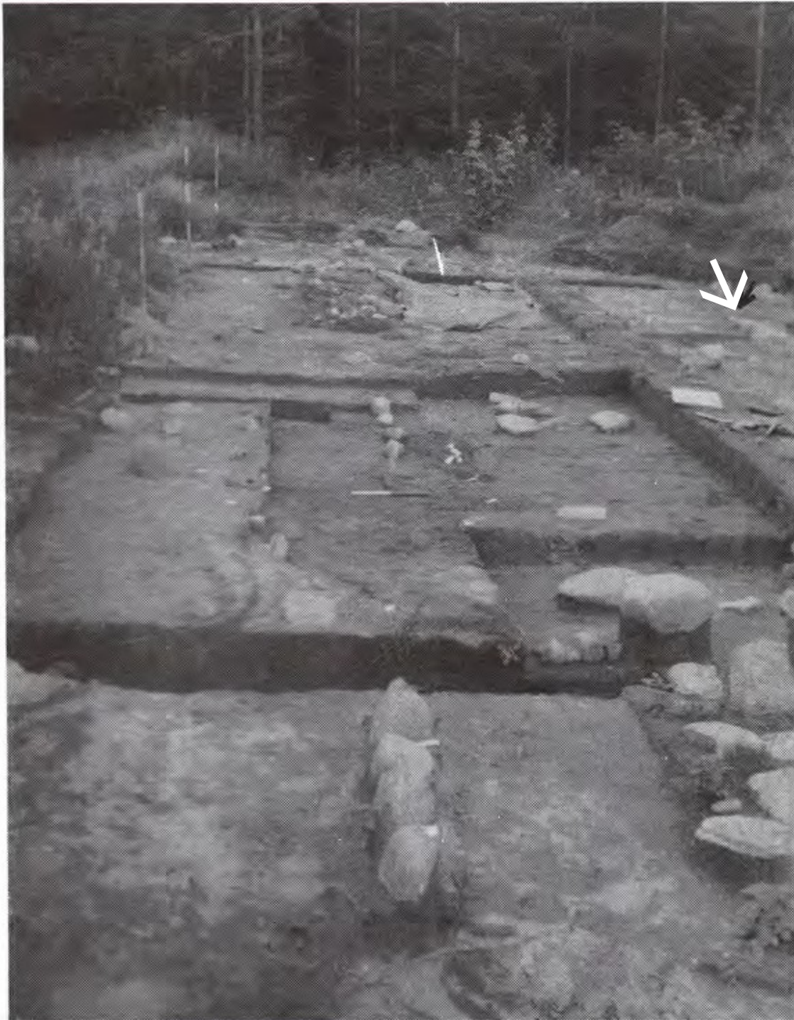
Udgravningsfeltet set fra vest. Bemærk syldstenene. Amen blev fundet ved pilen.

Under rekognosceringen opsamledes store mængder lerkarskår, hvorfor jeg besluttede at foretage nogle sonderinger med ejerens velvillige tilladelse. I den sydlige del af området åbnedes et felt på ca. 20 X 8 m, og i undergrunden fremkom temmelig sikre spor efter en velbevaret hustomt med lergulv og stensyld på langsiderne. Efter skårmaterialiet at dømme skal vi blive i tidlig romerskjernalder.